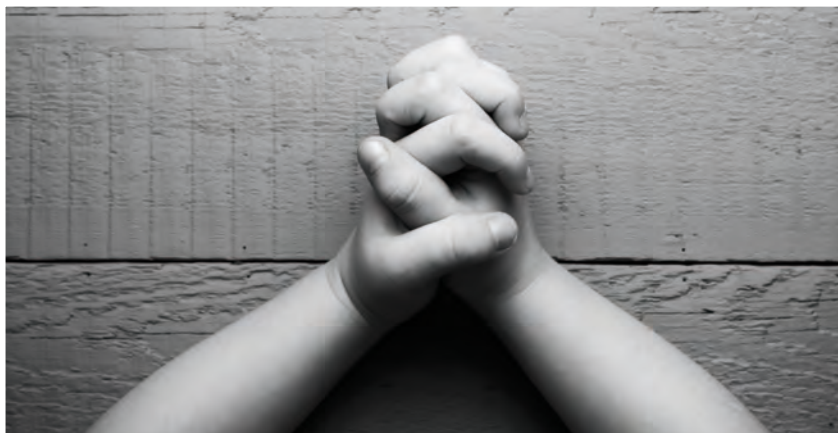
Bøn virker. Bønnenetværket gør det enkelt med konkrete bønneemner.

DFS har et bønnenetværk, hvor mennesker beder for arbejdet med at fortælle børn om Gud