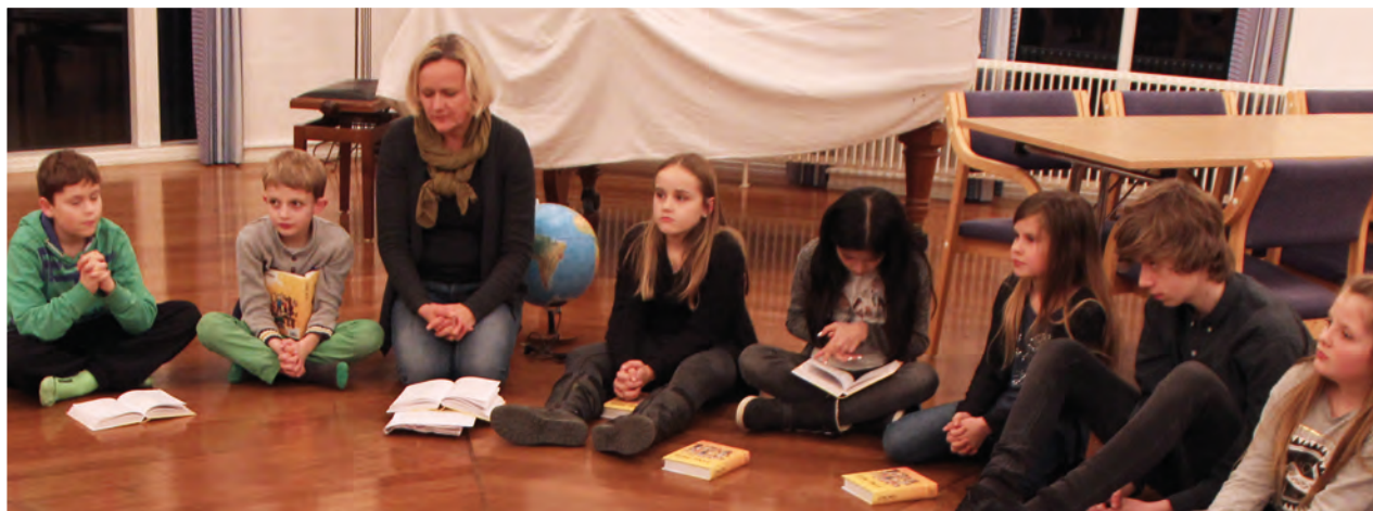
Børneklubben i Ringkøbing består af 14-15 børn og en god flok ledere. De mødes onsdage 18.30 til 20.